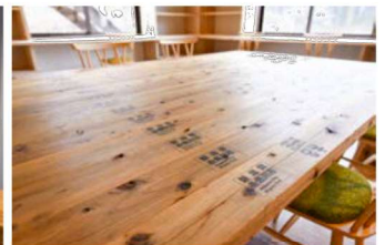
東京オリンピックで使用した糸魚川産杉材を再利用して製作した家具