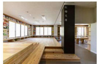
紅梅文庫 ワークエリア

7千冊を超える多様な蔵書に囲われたライブラリー。子供向けの本から専門書まで、ここに来るだけでワクワクするような場所。